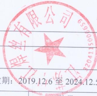
表 1 接受单位基本情况